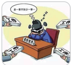
工作不作为乱作为