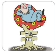
挥霍浪费公共财产