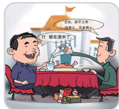
违规收受礼品礼金