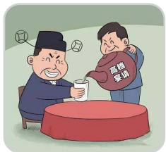
违规接受管理服务对象宴请